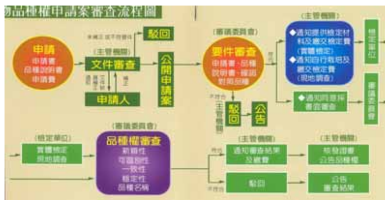
植物品種權申請案審查流程圖

所要進行的植物，若還沒有在名單內，可以向政府提出請求，要求政府準備公告接受這個植物的品種權申請